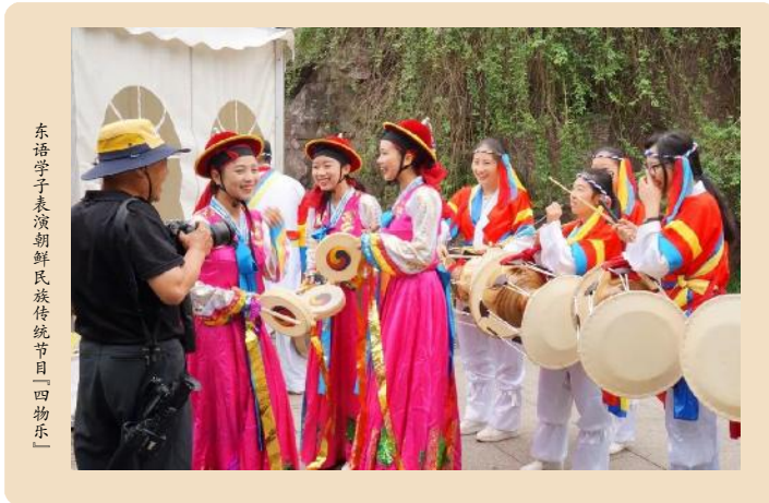
东语学子表演朝鲜民族传统节目(四物乐)

交流会,群策群力,共同提高育人水平。学院坚持以社会主义核心价值观为思想引领,以专业为导向,以实践为抓手,将德育教育、专业教育融入丰富多彩的校园文化活动。打造语言文化节、学风文化节等校园文化品牌,开展各语种配音比赛和各国人文历史知识竞赛、异域风情秀等活动,营造语言学习和文化体验的氛围。