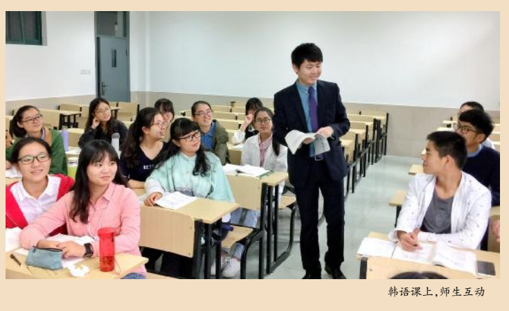
韩语课上,师生互动

【编者按】校党委书记宣勇在暑期中层干部读书会上要求,全校上下要形成一种“老师爱学术爱学生,学生爱学习爱学校”的良好局面。如何为营造这种局面和完善制度,推进工作,相关学院在专业外语教育中积极探索和实践。在人才培养方案、课程设置、教学模式、教学方法、教学评价等方面进行了一系列改革,通过创新人才培养思路,革新教学内容与方法,打造高水平教师队伍,创设良好育人环境,为提升学校的国际化办学水平不懈努力。