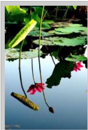
夏日倒影

我不讨厌夏天,不讨厌到处是长裙的季节。我只是有些懦弱,有些无法适应太快的变化。原谅一个小小自卑的我的无聊思绪,她只是有点固执。