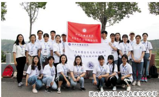
图为实践团队成员在梁家河合影

吃苦耐劳勤学习,矢志不渝立信念。作为一名师范生,梁家河之行,更加坚定了我的理想信念:严于律己,在保证专业成绩优秀的前提下,积极参与校内外活动,不断完善和提高自我,教书育人,报效国家。 (作者系电商学院、科技学院16数学1班学生)