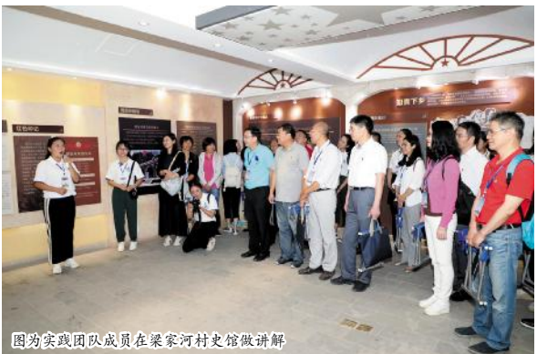
图为实践团队成员在梁家河村史馆做讲解